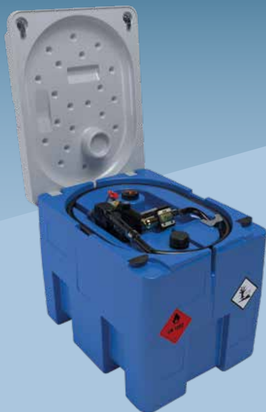
SERBATOIO 230 LITRI