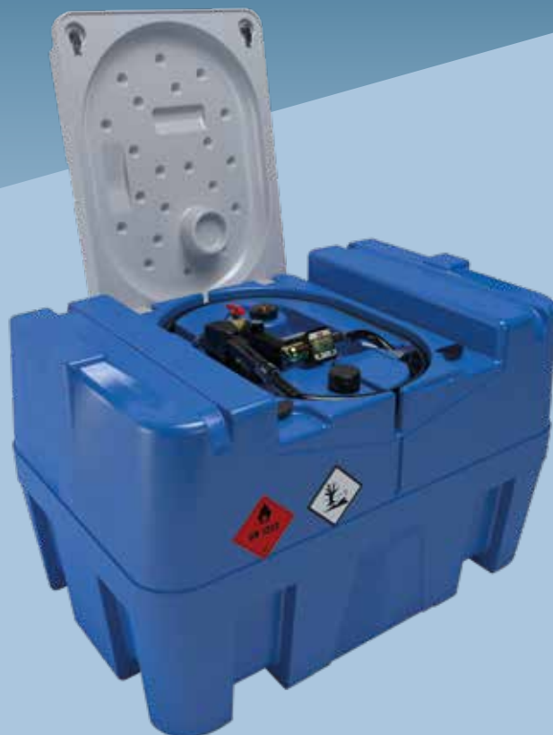
SERBATOIO 440 LITRI